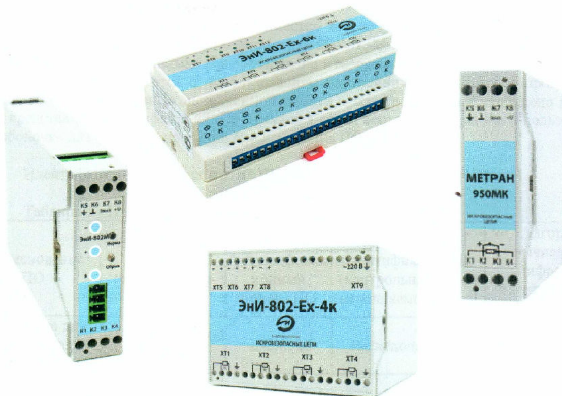
Рисунок 1 - Внешний вид ПИ

Защита ПИ от несанкционированного вскрытия обеспечивается нанесением клейма (пломбы) на корпус ПИ. Пломба представляет собой саморазрушающуюся наклейку, которая наносится в месте соприкосновения основания и крышки корпуса. Схема пломбировки представлена на рисунке 2.